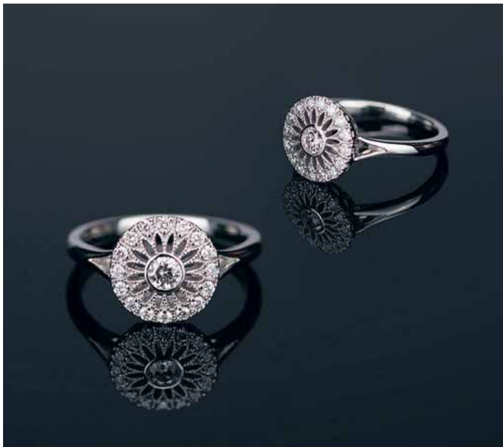
Ring 'Wheel Of Fortune', platina en diamant

gepersonaliseerde details toe te voegen aan een handgemaakt, hoogwaardig, mechanisch horloge. We kunnen speciale opdrukken in de wijzerplaat toevoegen, of gravures aanbrengen op het achterdeksel van de kast van het horloge. Zo vertelt een horloge weer een persoonlijk verhaal, dat generatie op generatie doorgegeven kan worden.