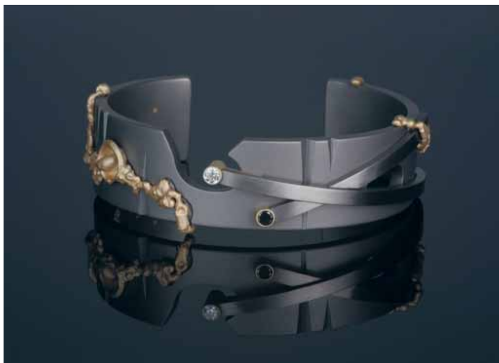
Armband met oude titanium trouwringen