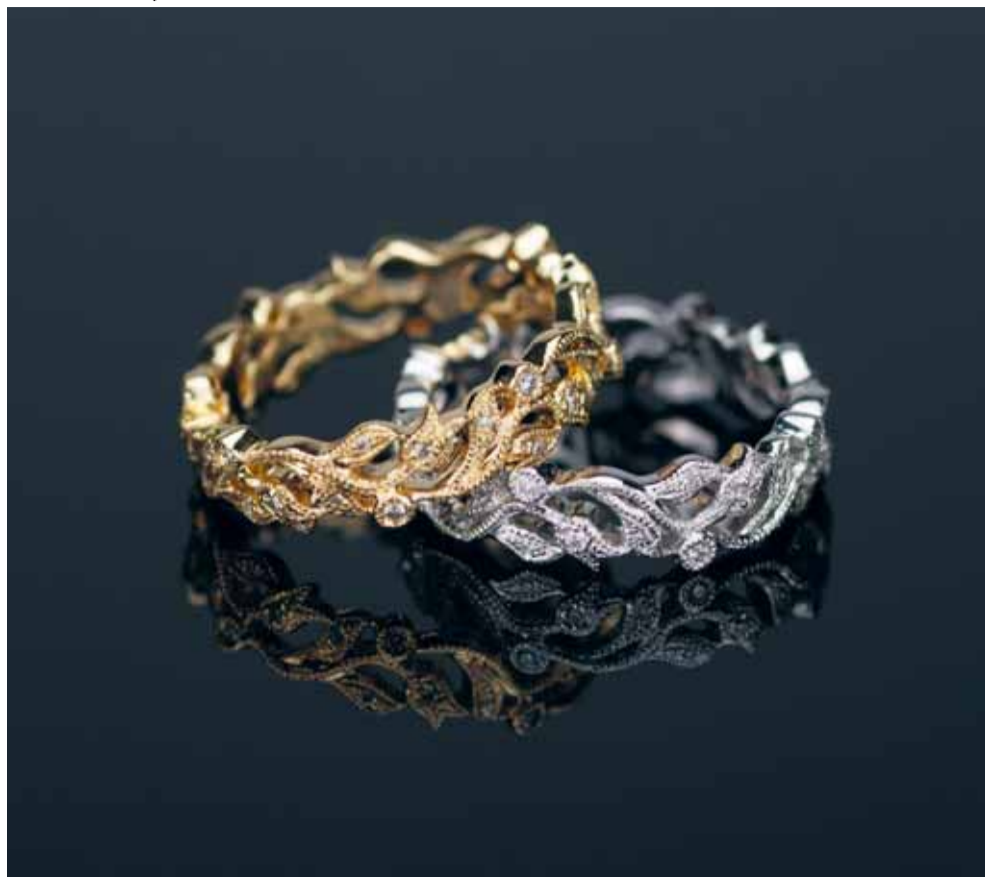
Springrings, 18 kt geelgoud, platina en diamant