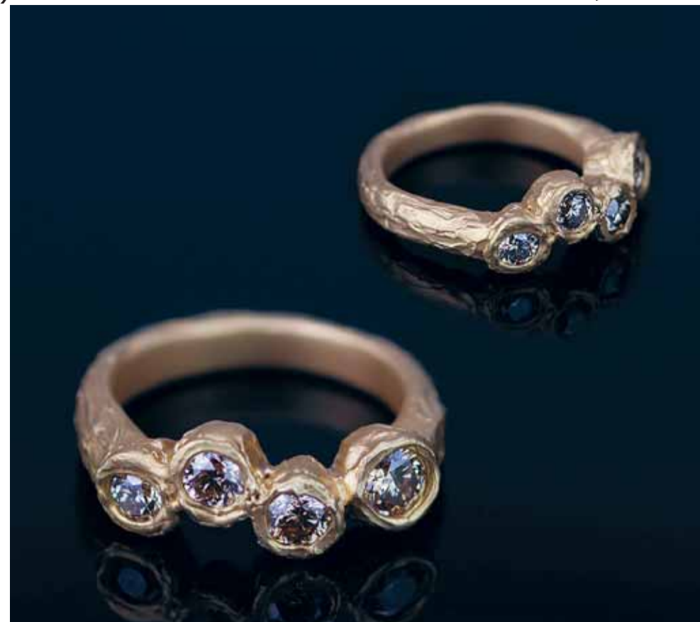
'Pure Structures' in 18 kt goud met champagne diamanten

Het gebeurt regelmatig dat vaders zo'n uniek en karakteristiek horloge willen geven aan hun zoon. Je zou de silhouetten van vader en zoon, of van moeder en zoons in het horloge