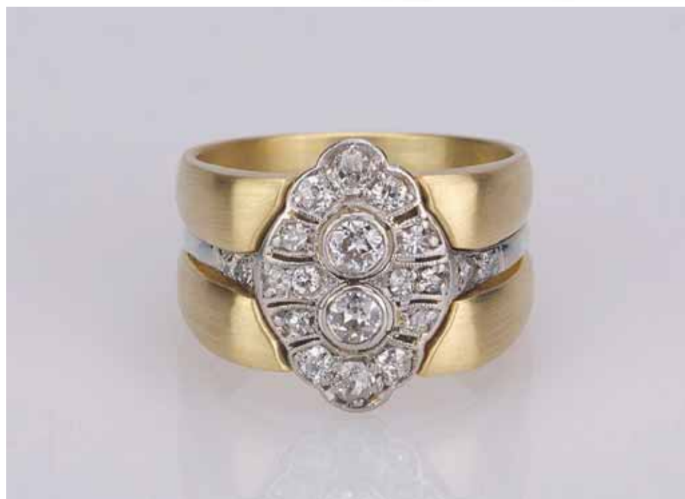
Oud naar nieuw, geel- en witgoud en diamanten