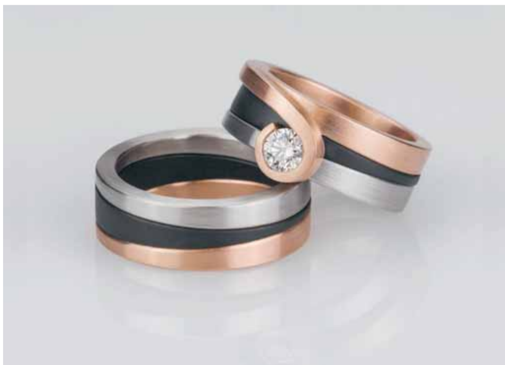
Trouwringen 'Ozephilac', wit- en roségoud, zirconium en diamant