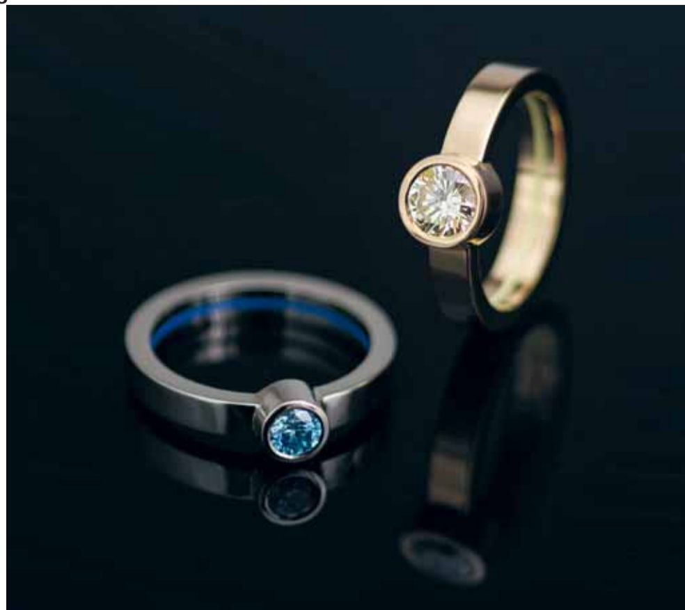
Bauhaus ringen in wit- en geelgoud, bezet met blauwe en lichtgele diamant